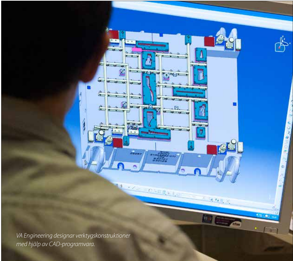
VA Engineering designar verktygskonstruktioner med hjälp av CAD-programvara.

VA Engineering AB (tidigare PR ToolDesign AB) består av ett team teknik konsulter med verksamhet i Tyringe. Bolaget har mångårig erfarenhet av högkvalitativa verktygskonstruktioner i en avancerad CAD-miljö och utför simulering av plåtförmjning i Autoform och NC-beredning i programmet Tebis. VA Engineering erbjuder processberedning, konstruktion, plåtsimu-