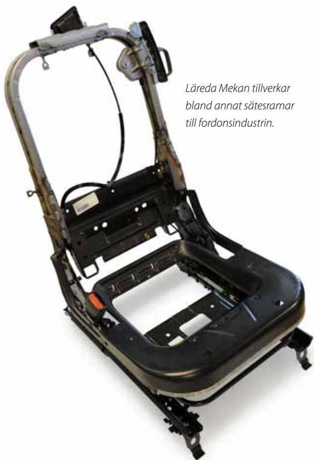
Läreda Mekan tillverkar bland annat sätesramar till fordonsindustrin.

Läreda Mekans erfarenhet av säkerhetsprodukter garanterar höga krav på säkerhet, funktionalitet och kvalitet. Bolaget är kvalitetscertifierat enligt ISO/TS 16949:2009 samt miljöcertifierat enligt ISO 14001:2004. Detta utgör ett integrerat sätt att leda arbetet inom kvalitetssäkring samt inom miljö, energi, arbetsmiljö och hälsa. Även Läreda Mekans underleverantörer arbetar enligt bolagets standarder och rutiner för kvalitetssäkring. Effektiv organisation och ständiga förbättringar i processer och rutiner har alltid lagt grunden för kvalitetssäkring inom Läreda Mekan.