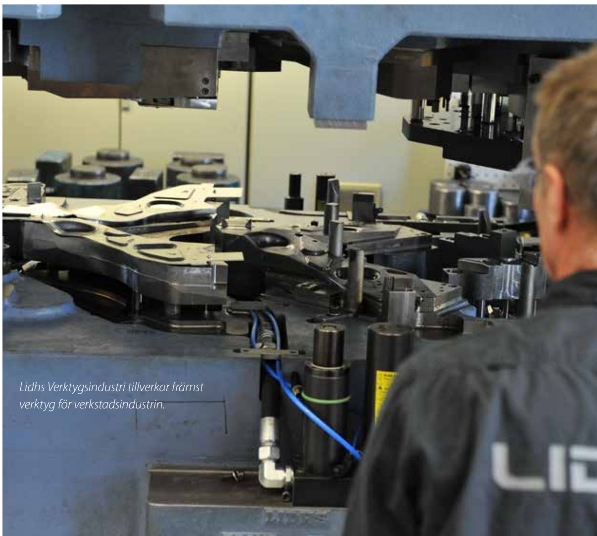
Lidhs Verktögsindustri tillverkar främst verktyg för verkstadsindustrin.

Under 2012 förvärvade VA Automotive Lidhs Verktögsindustri AB inom ramen för affärsområdet verktögs teknik. Bolaget designar, tillverkar och säljer avancerade verktyg för verkstadsindustrin i Sverige och Europa. Cirka 40 procent av omsättningen är hänförlig till export. Genom högteknologiska metoder och tillgångar produceras avancerade verktögs lösningar för modern produktionsutrustning. Lidhs Verktögsin-