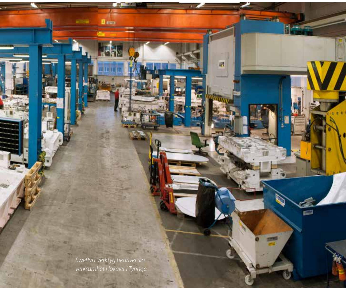
SwePart Verktyg bedriver sin verksamhet i lokaler i Tyringe.

produktion av högkvalitativa komponenter till fordonsindustrin. Inom fordonsindustrin används verktygen bland annat till serieproduktion av såväl exteriöra paneler och förstärkande delar till dörrar och tak som interiöra komponenter. SwePart Verktyg har omfattande erfarenhet av verktygstillverkning oavsett verktygens komplexitet, geometri, storlek och typ av metall. Vidare tillhandahåller bolaget service och underhåll av verktyg, reservdelar, mätning och inspektion med mera.